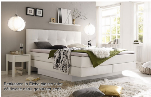
Bettkasten in Eiche bianco oder Wildeiche natur gebürstet geölt